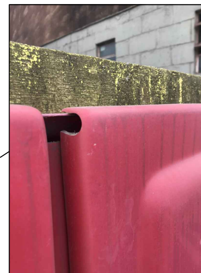
DETALHE: MODELO DE ENCAIXE DA PORTA